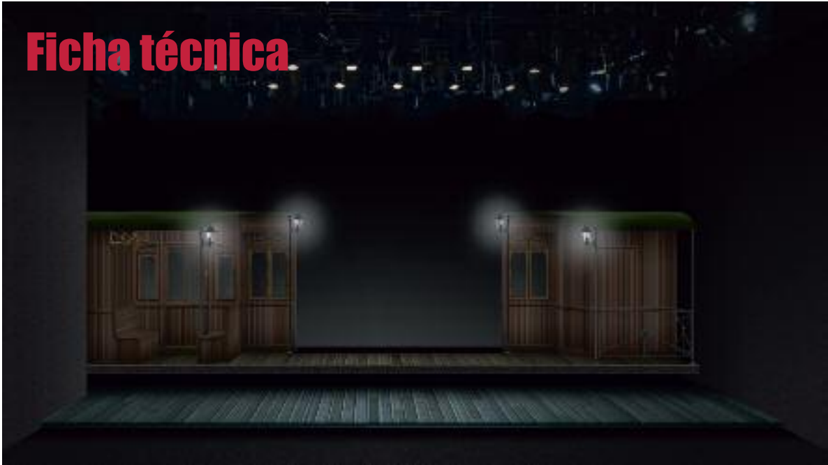
Boceto de escenografía: Nicolás Bueno